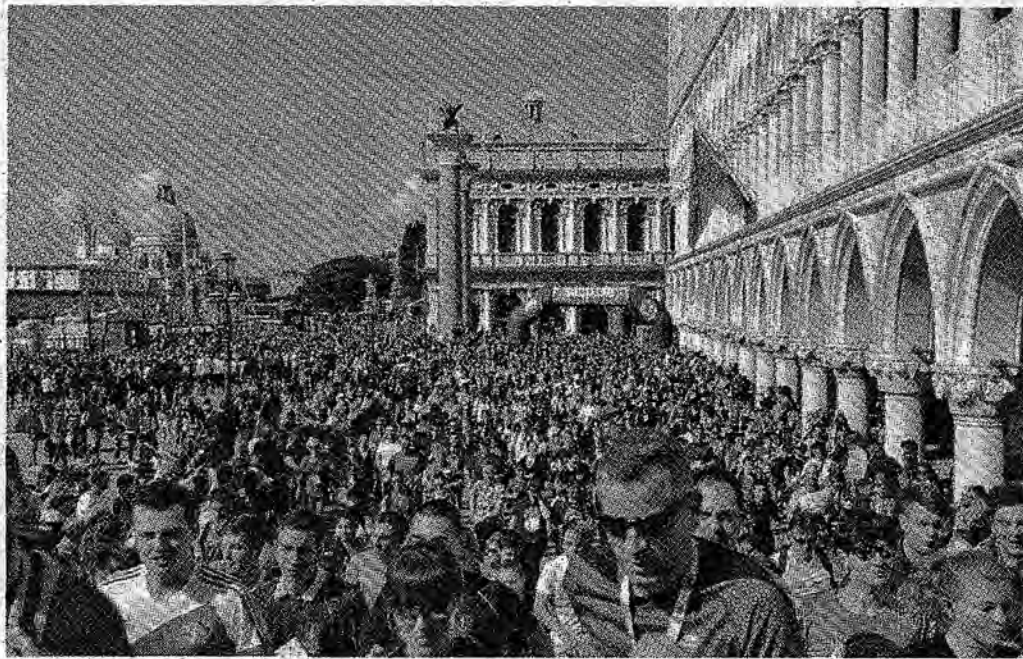
La fiumana di partecipanti alla “Su e zo per i ponti” subito dopo la partenza da piazzetta San Marco

Festa riuscita. «Non era mai successo. È una festa riuscita. Per noi il turismo sostenibile diventa anche turismo solidale. Per il prossimo anno si sta già pensando a qualcosa per la Venezia minore e per il carcere maschile di Santa Maria Maggiore.