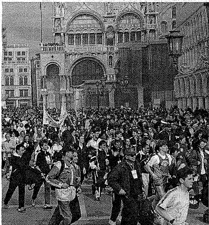
Passaggio in Piazza San Marco